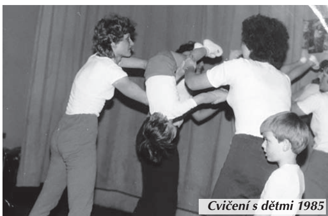
Cvičení s dětmi 1985