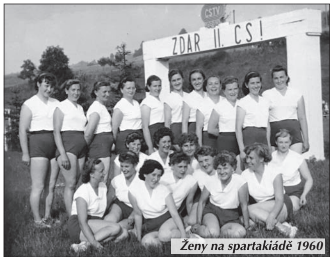
Ženy na spartakiádě 1960

Spartakiády se konaly od roku 1955 do roku 1985 pravidelně každých pět let, mimo rok 1970. Halenkovjané se účastnili spartakiádního cvičení od roku 1960. Tenkrát cestovali do Prahy vlakem jen muži a ženy. Další spartakiády v roce