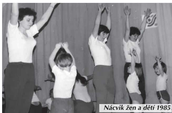
Nácvik žen a dětí 1985