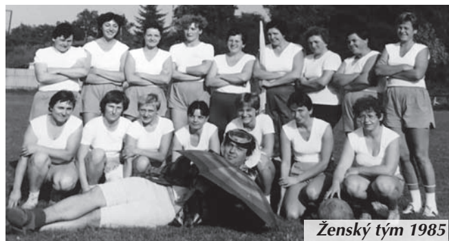
Ženský tým 1985