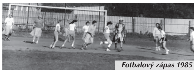
Fotbalový zápas 1985