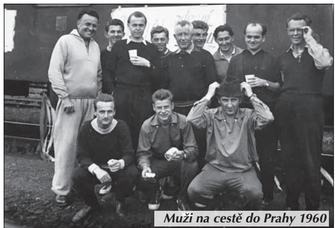
Muži na cestě do Prahy 1960