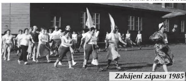
Zahájení zápasu 1985