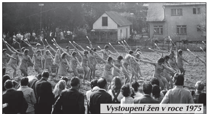
Vystoupení žen v roce 1975