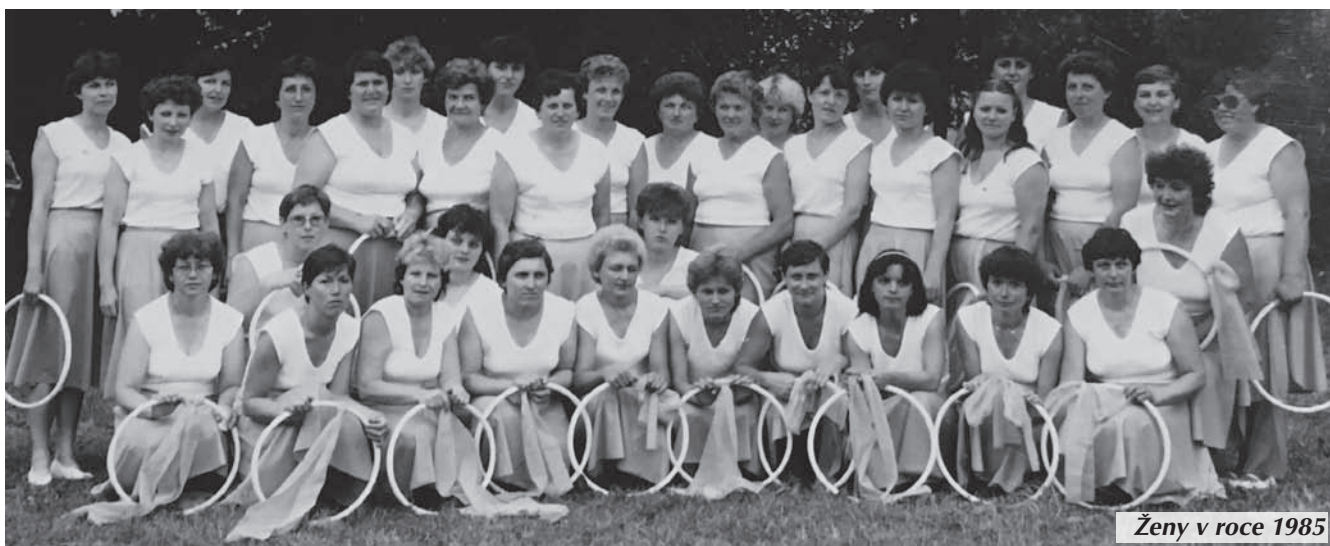
Ženy v roce 1985