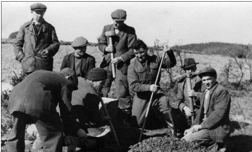
Stavba kříže.