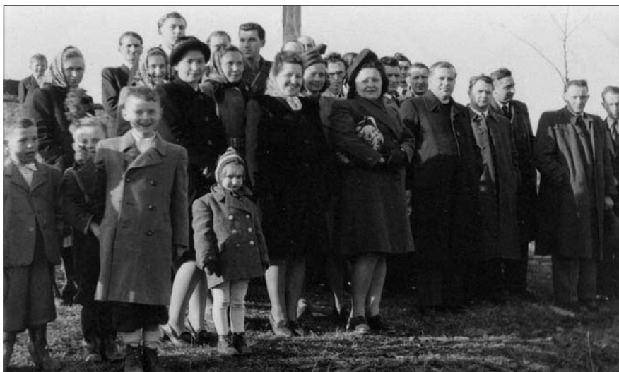
Svěcení kříže.