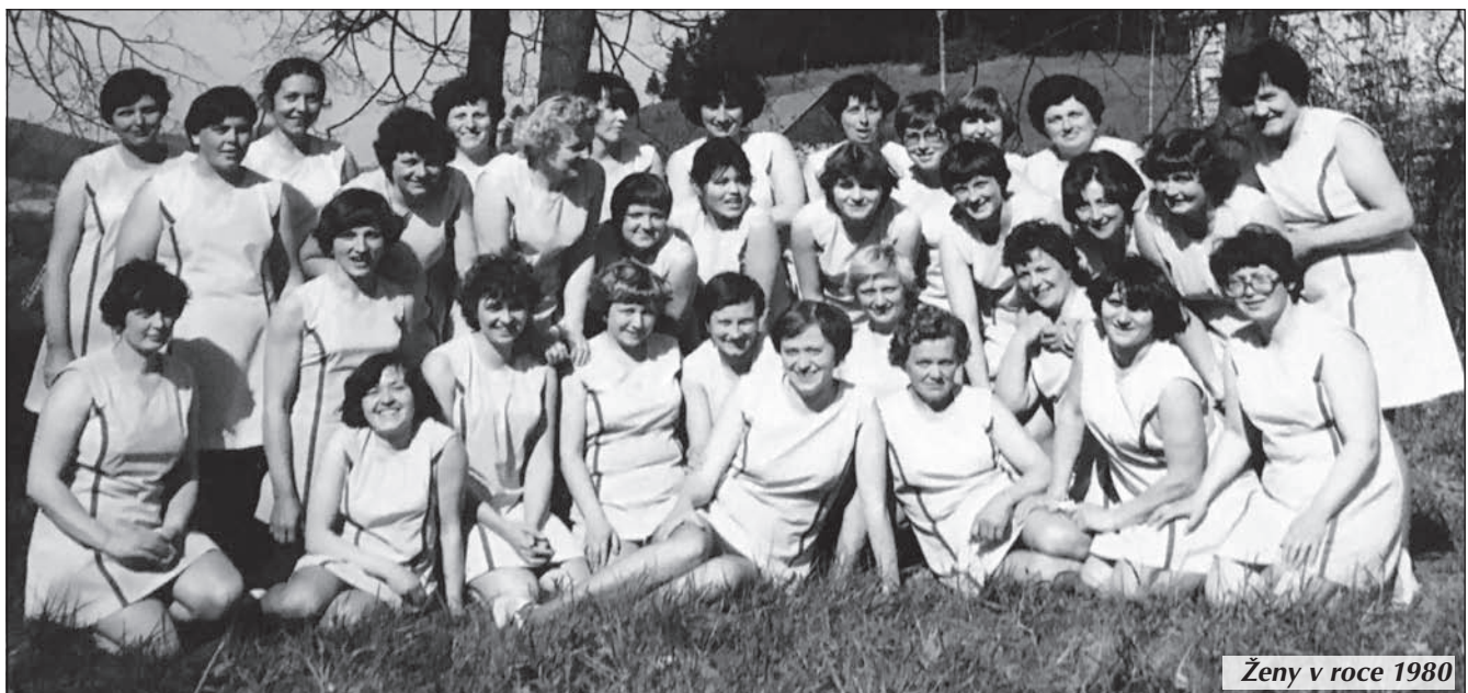
Ženy v roce 1980